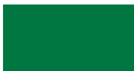
068 ~HKS 57 Grass green Grasgrün Herbe Trawiasto zielony Травянисто зеленый