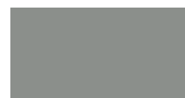
074 ~RAL 7042 Middle grey Mittelgrau Gris moyen Pośredni szary Средне-серый