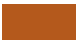
083 ~RAL 8023 ~HKS 81 Nut brown Haselnussbraun Brun noisette Orzechowy Ореховый