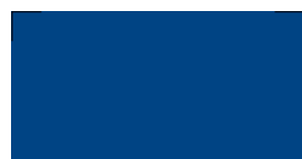
051 ~HKS 44 Gentian blue Enzianblau Bleu gentiane Ciemny niebieski Генциановый синий