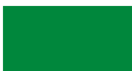
062 Light green Hellgrün Vert clair Jasny zielony Светло-зеленый