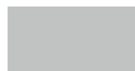
072 ~RAL 7035 Light grey Hellgrau Gris clair Jasny szary Светло-серый