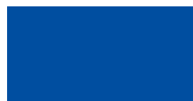
098 ~HKS 44 Gentian Enzian Gentiane Ciemny lazurowy Генциановый