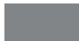
076 ~RAL 7045 Telegrey Telegrau Télégris Popielaty Серый телеком