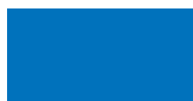
084 Sky blue Himmelblau Bleu ciel Błękitny Небесно-голубой