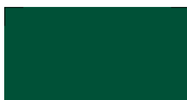
613 Forest green Waldgrün Vert forêt Leśny zielony Лесной зеленый