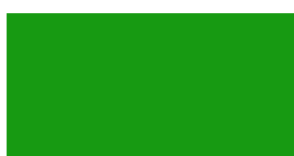
064 ~RAL 6018 ~HKS 65 Yellow green Gelbgrün Vert jaune Żółto-zielony Желто-зеленый