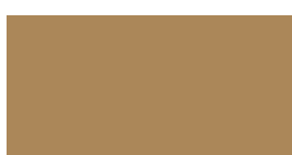
081 Light brown Hellbraun Brun clair Jasny brązowy Светло-коричневый